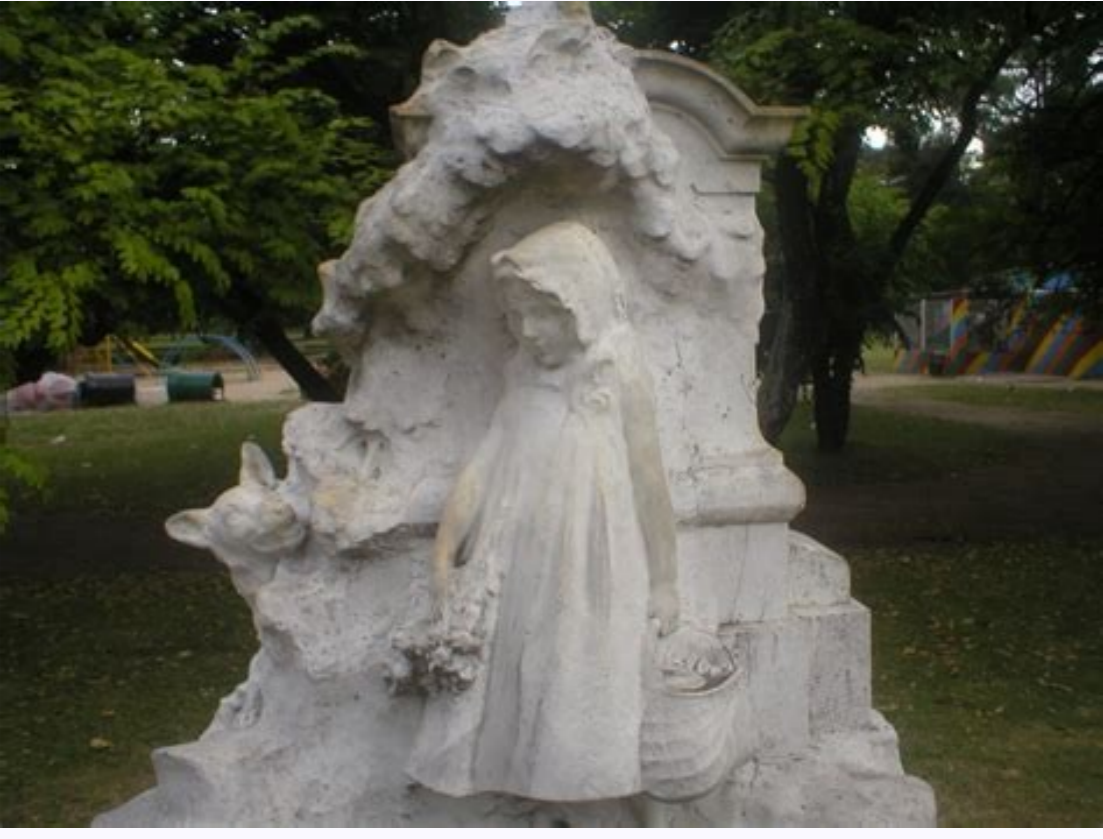
Autor del cuento caperucita roja y el lobo feroz. Personajes del cuento de caperucita roja y el lobo feroz. Cuento de la caperucita roja y el lobo feroz corto. Cuento de caperucita roja y el lobo feroz. Video cuento de caperucita roja y el lobo feroz. Cuento escrito de caperucita roja y el lobo feroz. Quiero el cuento de caperucita roja y el lobo feroz. Video del cuento caperucita roja y el lobo feroz.